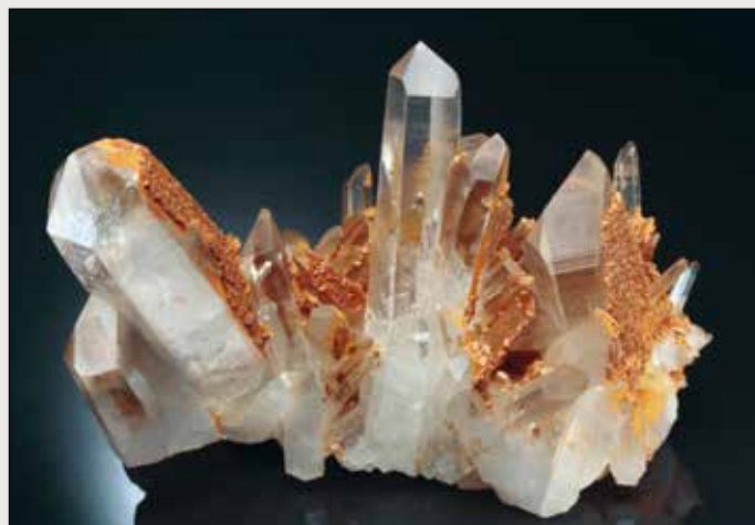
Quarzo con magnesite: campione di 20 cm proveniente dalla classica località del Dosso dei Cristalli, in Valmalenco, Sondrio, Italia. Coll. G. Schenatti.

Nell'ambito della mineralogia europea l'Italia è grande protagonista con località classiche che hanno fornito mineralizzazioni uniche al mondo per bellezza e rarità; basti pensare all'Isola d'Elba, al Vesuvio, alle miniere di zolfo siciliane, a Carrara, a Baveno, alle miniere della Sardegna, solo per citarne alcune tra le più importanti. La peculiarità di queste